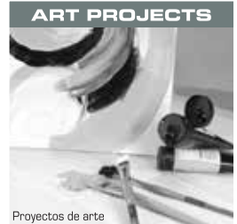
Proyectos de arte