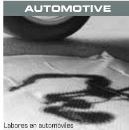
Labores en automóviles