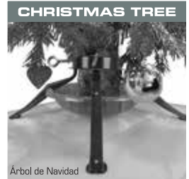
Árbol de Navidad