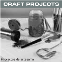
Proyectos de artesanía